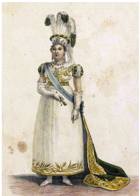
Figura 4: Imperatriz Leopoldina Jean-Baptiste Debret, 1821 aquarela e lápis, 18x23 cm

O traje desenhado para a futura imperatriz era claramente inspirado nas tendências de moda ditadas pela França (figura 4). Com as devidas adaptações, essas foram as marcas das criações de Debret para a vestimenta, auxiliando na impressão do modo de vestir francês na moda brasileira. Com isso, o artista não somente registra o modo de vestir no Brasil, influenciado pelo orientalismo indiano e chinês – e que dividia espaço nas ruas com trajes e cores oriundos da África e dos índios nativos –, mas interfere na construção dessa identidade, propondo um afrancesamento do vestuário nos trópicos e suas criações para a corte, com referências à moda francesa.