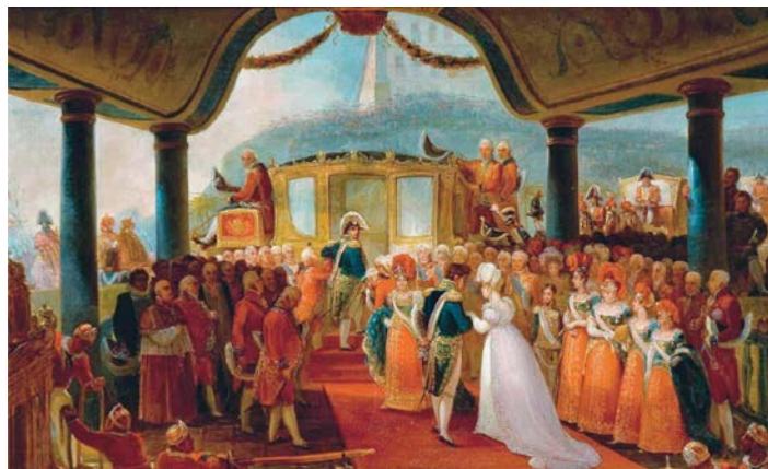
Figura 1: Desembarque de D. Leopoldina no Brasil

Fato é que a juntamente com a missão, Jean-Baptiste Debret desembarca no Brasil e instala-se no Rio de Janeiro. Como pintor oficial da corte, registra momentos importantes da monarquia, como a aclamação de Dom João VI, a chegada da princesa Leopoldina (figura 1), a coroação de Dom Pedro I, além de diversos retratos da família real.