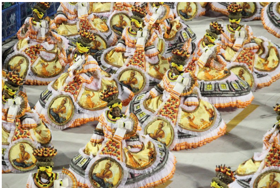
Figura 5: Baianas da escola de samba São Vicente com trajes inspirados na obra de Debret

É inegável a contribuição de Debret para o entendimento e construção de uma identidade brasileira da moda e da indumentária. Através da análise de suas obras é possível perceber não somente sua expressividade artística, mas também sua contribuição para a compreensão dos usos dos vestuários e adornos no cotidiano social em meados do século XIX brasileiro e os costumes da população que habitava a Luso-América. Tal análise interpreta a importância cultural e social das vestes para a população brasileira neste período, uma vez que a história da moda permite aproximarmos-nos da história de um grupo de cidadãos, de um povo ou, até mesmo, de uma sociedade.