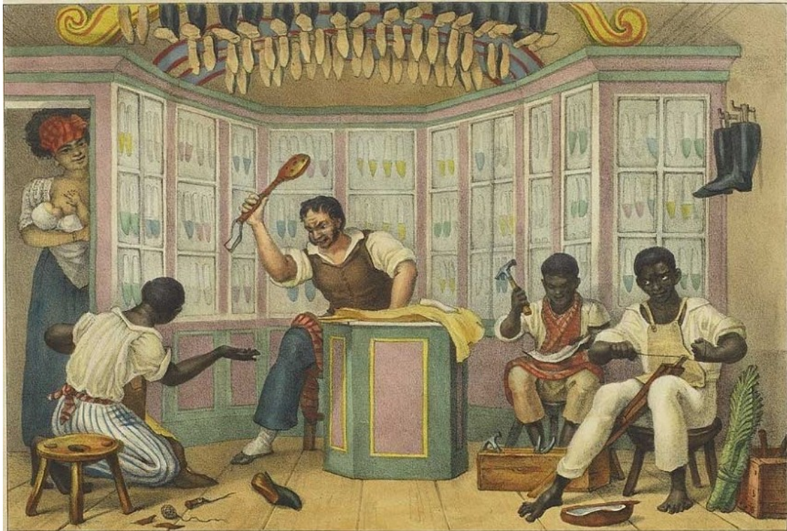
Figura 2: Loja de Sapateiro Jean-Baptiste Debret Litografia, 19,9x23,8 cm